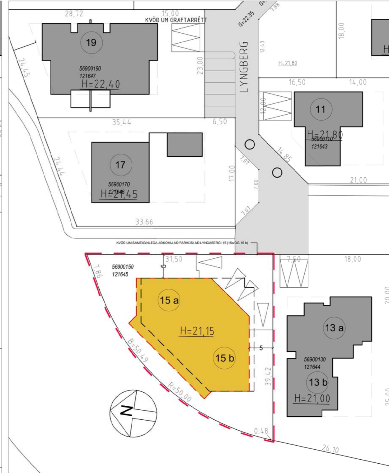
Tillaga að breyttu deiliskipulagi fyrir Lyngberg 15 - 1:500