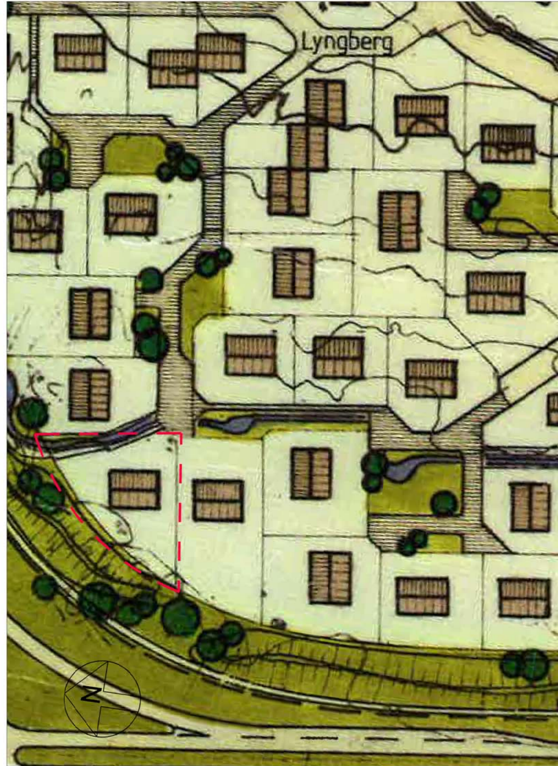
DEILISKIPULAG SETBERGS VAR SAMÞYKKT AF BÆJARSTJÓRN HAFNARFJARÐAR ÞANN 18. JANÚAR 1983 - 1:1000