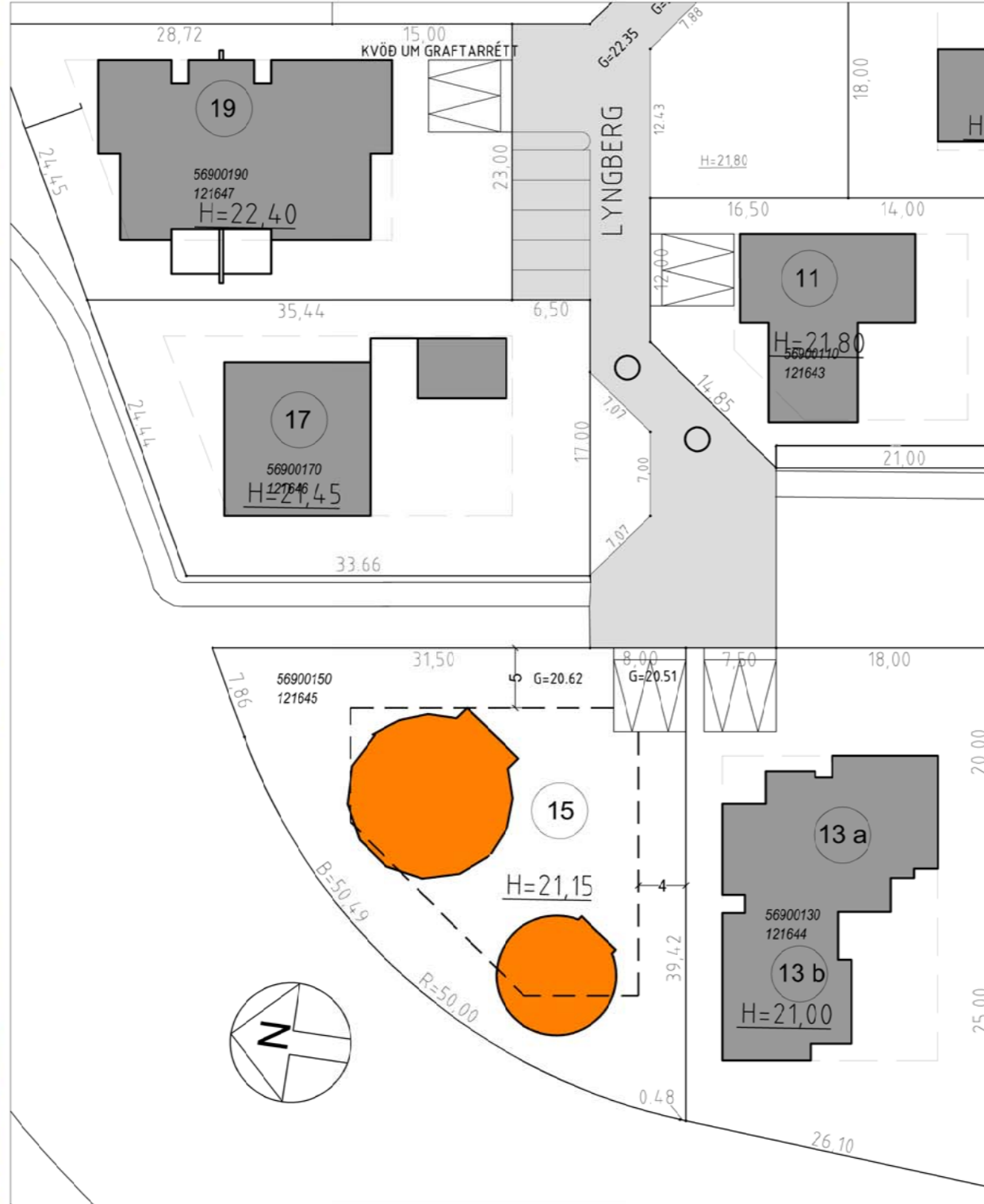
Mæliblað fyrir Lyngberg 15 - 1:500